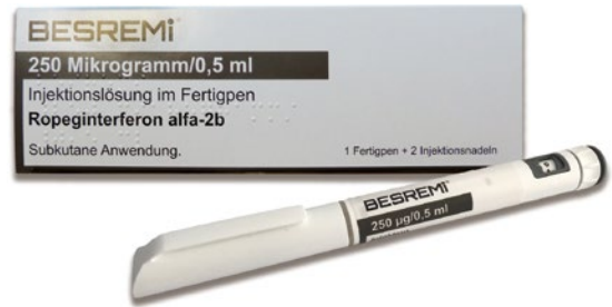
圖 5 / Besremi® 歐洲銷售商品圖

針對台灣市場，我們於 2020 年 5 月取得台灣 TFDA 上市核可，並由本公司收購自組的行銷團隊，並預計於 2021 年第 1 季以商品名百斯瑞明® 開始銷售。為確保新藥導入時程及策略無誤，我們積極與臨床醫師溝通，並對特定市場訊息例如：臨床需求和競品策略等，執行有系統的蒐集分析。我們也將投入更多的行銷資源，並併購台灣白血病藥品銷售市佔率最高的銷售團隊，加強在病人端的衛教支持，讓病人更理解百斯瑞明® 對於長期療效在疾病控制上的好處。並鼓勵醫師優先鎖定在較年輕、對於針劑抗拒可能性較低的病人身上，且與醫師溝通早期用藥以降低後續的骨髓纖維化跟白血病風險的好處，促使醫師提早處方新藥。此外，透過每年舉辦亞太骨髓增生性腫瘤 (Myeloproliferative neoplasms) 研討會，與各國醫生彼此交流亦可加強對百斯瑞明® 新藥的認識，期望提升我們的藥品在市場的能見度與銷售量，也為臨床上因疾病所苦的病患帶來更好的治療效果。