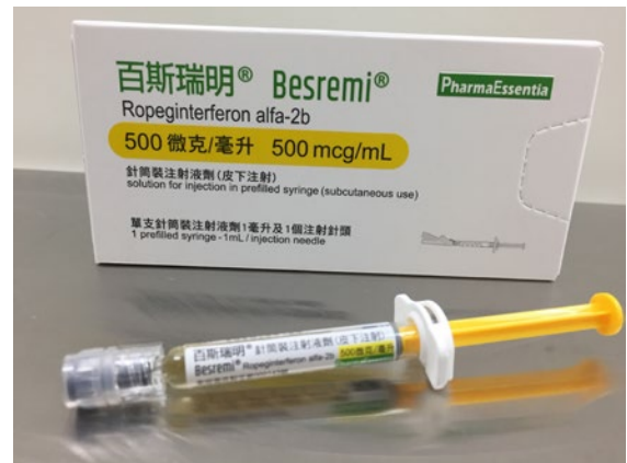
圖 6 / 百斯瑞明® 台灣銷售商品